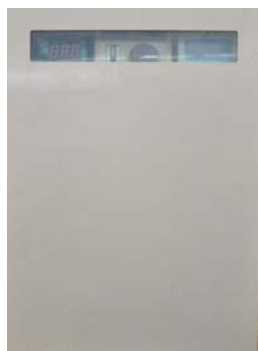
旧制御盤をお使いの方