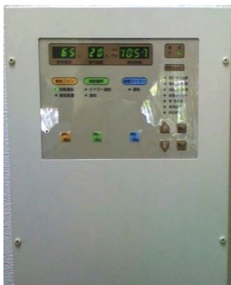
大崎制御盤をお使いの方 (1992年12月～1995年3月まで供給)

制御盤の白いカバーをドライバーではずし、中にある制御盤の電源をOFFにすることで、「停止」状態になります。