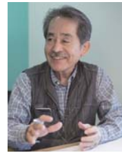
設計者 水上 勝之氏