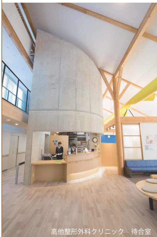
高他整形外科クリニック 待合室