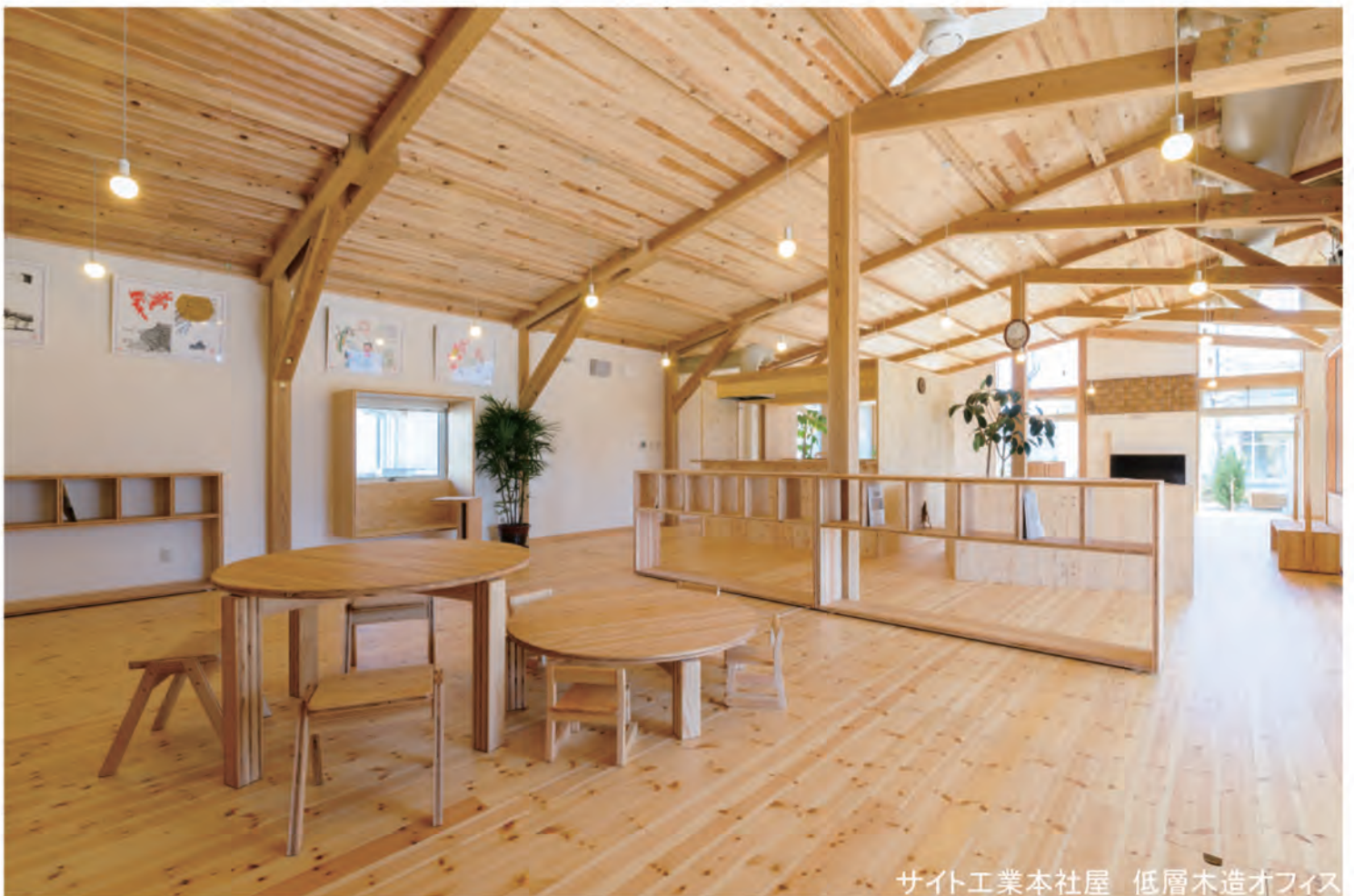
サイト工業本社屋 低層木造オフィス