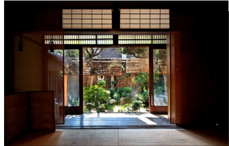
会場：豊崎長屋 主屋内観